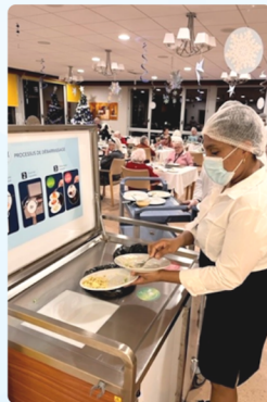
Prise en main des chariots connectés - 1er jour de déploiement

Son innovation 360° répond à un cadre réglementaire de plus en plus strict qui impose aux établissements sanitaires et médico-sociaux d'adapter leurs pratiques